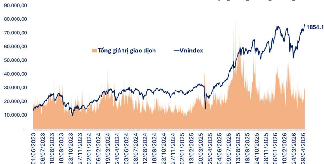
VN-Index biến động tăng trong tháng 4